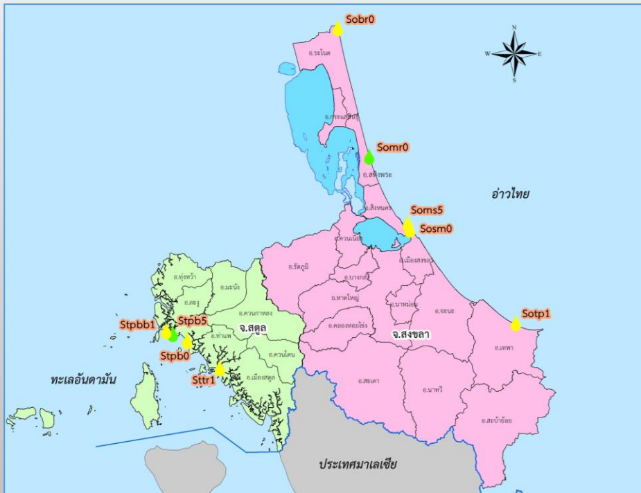
จุดตรวจวัด 9 จุด