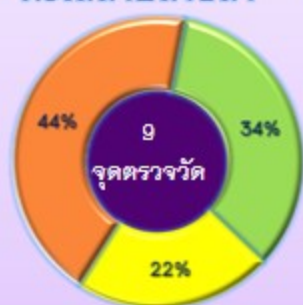
คลองสาขาทะเลสาบสงขลา